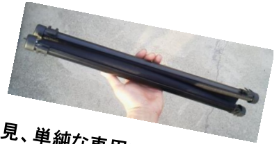
一見、単純な車用ロールアップシェード

「出来すぎてゴメンナサイ・・・」そんな言葉が似合うアイテムのご紹介です！ 世の中では、ちょっと出来ない性質のほうが愛着があって親しまれるなか、 これ以上はもう結構ですというくらいの秀才君「ロールアップ・座・シェード」。 夏の日差しから我が子を守るための最強日よけです！