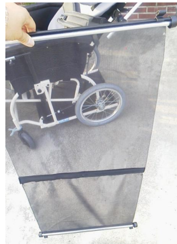
なんと両方向に伸縮するのだ