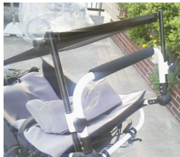
あとはシェードを引っ掛けておしまい