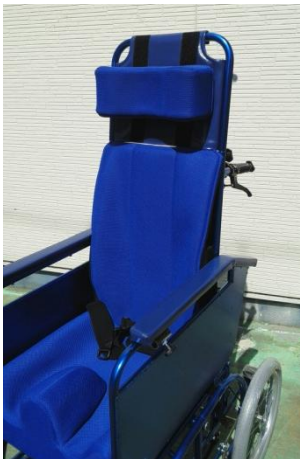
車椅子にマジックテープ止め