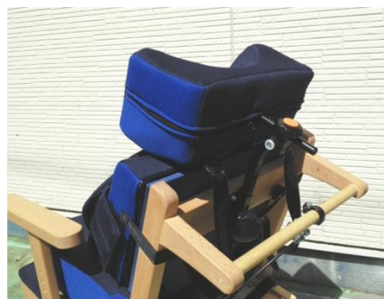
座位保持装置に頸部継手で固定