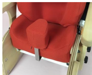
内転パッド金具付き モールドクッション