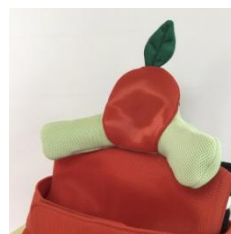
3D継手付きヘッドサポート