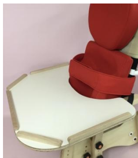
カットアウトテーブル